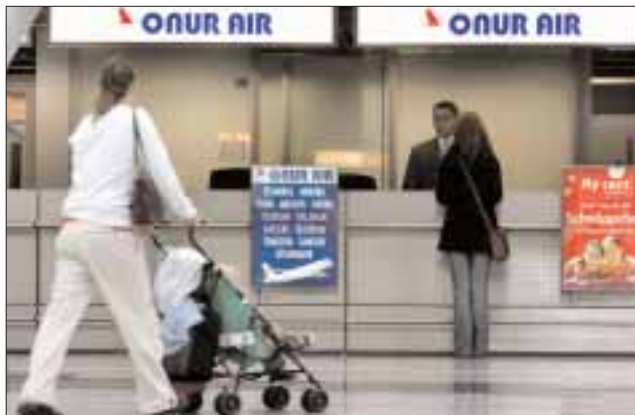
LES COMPTOIRS de la compagnie Onur Airlines samedi à Düsseldorf, en Allemagne.

DATA 1,4 million. C'est le nombre de passagers que transporte Onur Air chaque année